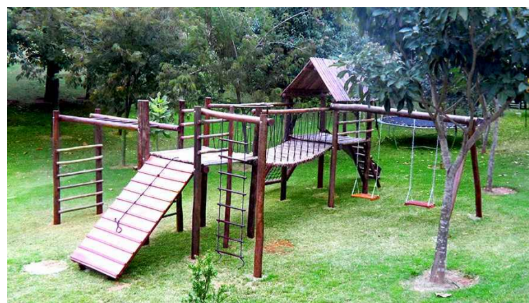
Aldeota de 03 a 12 anos