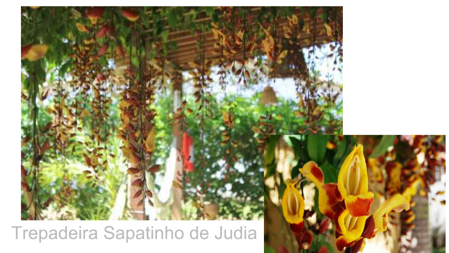
Trepadeira Sapatinho de Judia