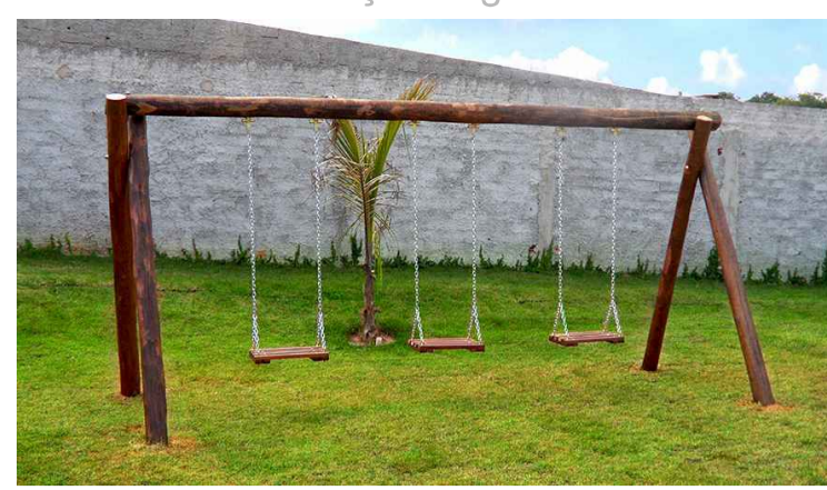
Balança 3 lugares