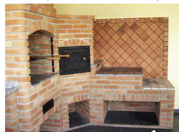
churrasqueira, forno a lenha e pizza